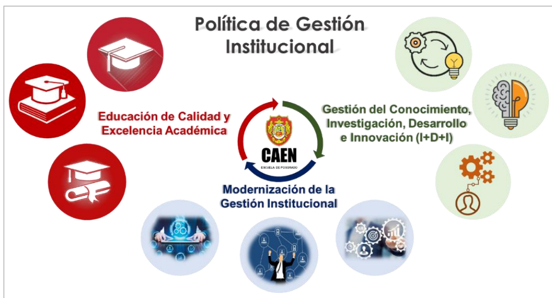
Figura 2. Políticas de Gestión Institucional del CAEN-EPG. Elaboración: Oficina de Planeamiento y Presupuesto – OPP del CAEN-EPG.