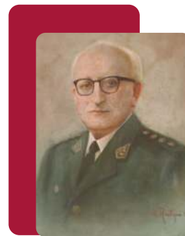
General de División José del Carmen Marín Arista

Capacitar, perfeccionar y especializar a profesionales militares y civiles en el conocimiento e investigación científica en las áreas de seguridad, defensa y temas de desarrollo vinculados a éstas áreas; a nivel estratégico nacional.